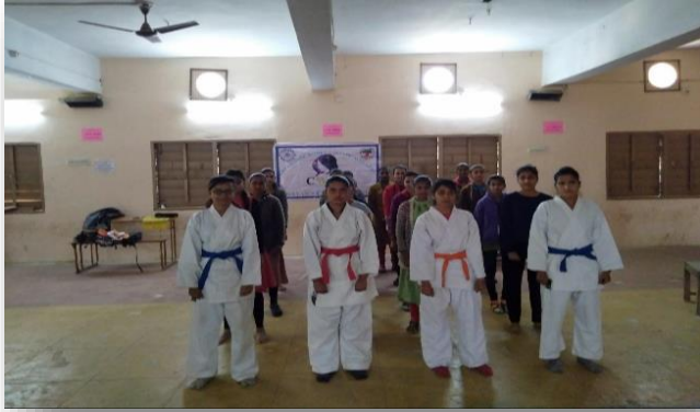
CWDC : Karate