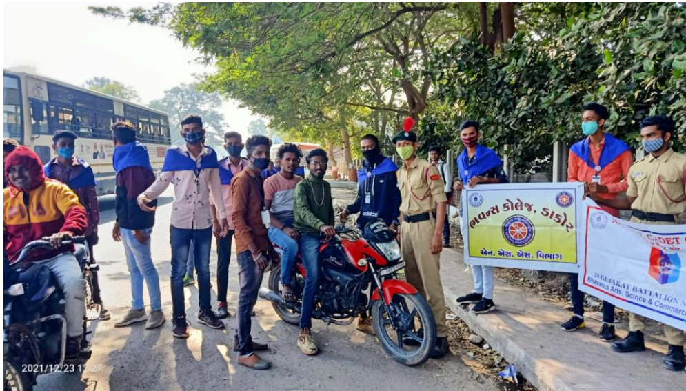
Traffic Safety Day