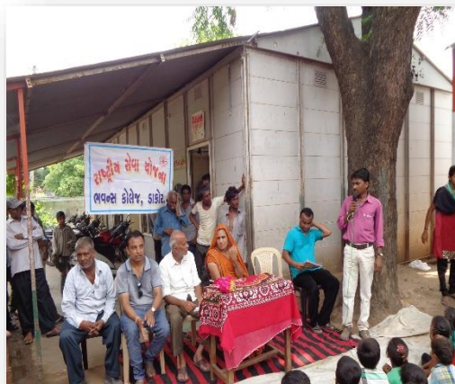
NSS : Visit to A Village