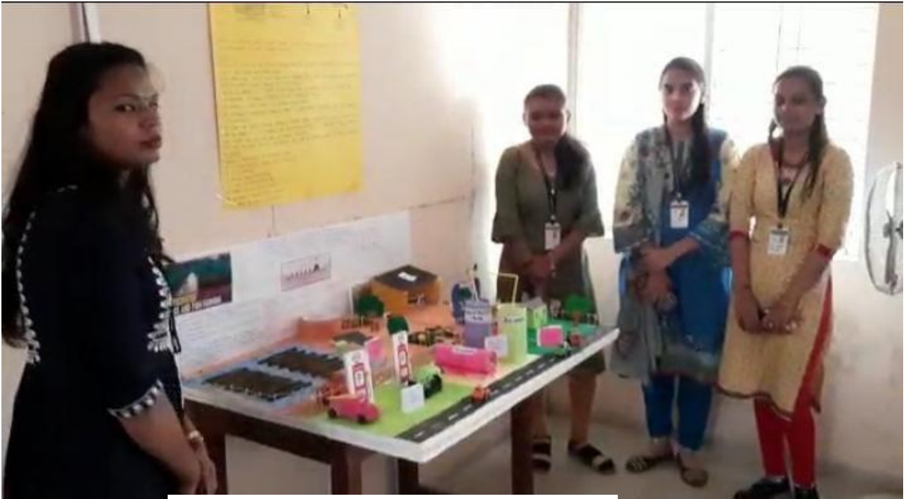
National Science Day Celebration