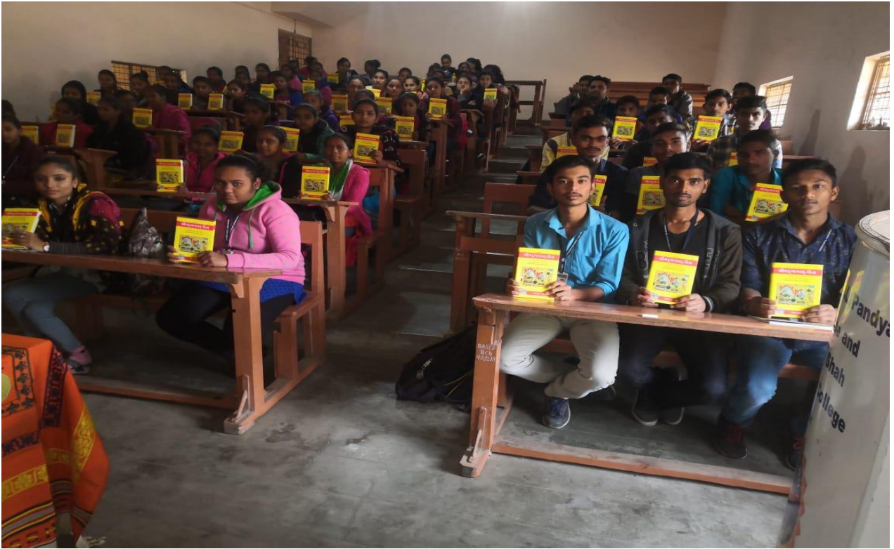
Gita Jayanti Celebrations