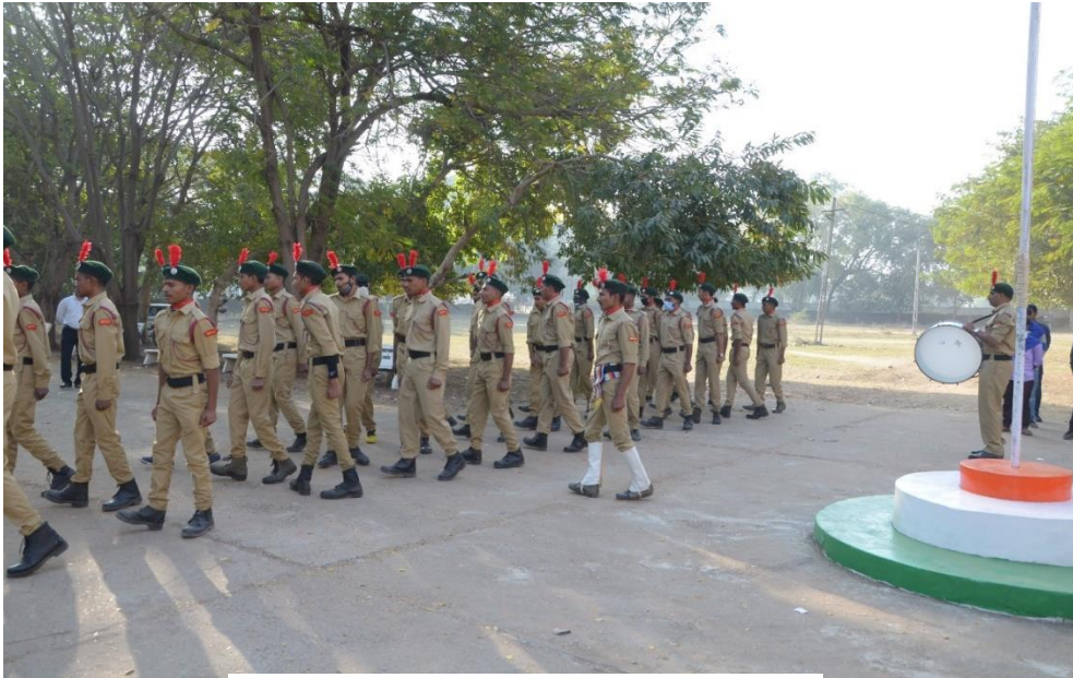
Republic Day Celebration